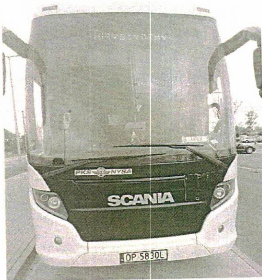
OP1790P - wykup po leasingu