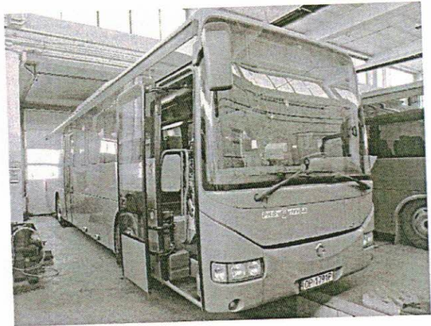
OP1789P - wykup po leasingu