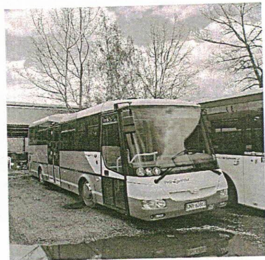
OP1791P - wykup po leasingu