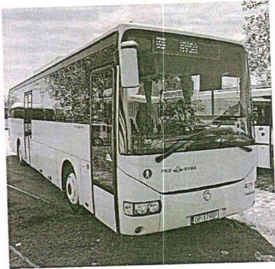
OP1788P – wykup po leasingu